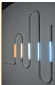
Astropol, créateurs de luminaires sur-mesure

Chaque jour, les visiteurs pourront aller à la rencontre de créateurs et assister à des projections de films leur permettant de mieux comprendre l'univers de ces métiers.